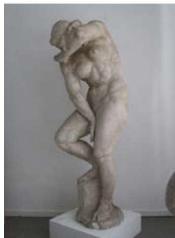
11. Brijunski akt (Stid, Eva) 1948. gips vis. 173 cm bez signature Hrvatski muzej arhitekture HAZU varijanta