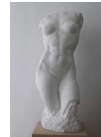
15. ŽENSKI TORZO 1941. gips vis. 95 cm bez signature inv. br. GA – 85 b odljev/model? kamene verzije