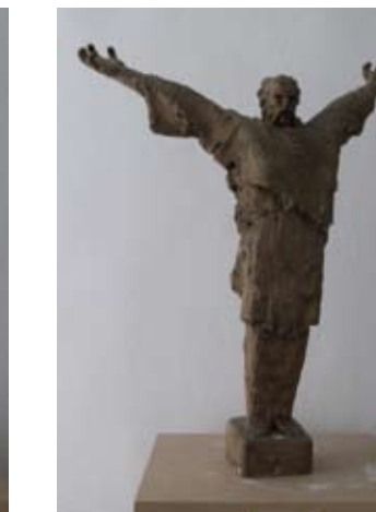
18. FIGURA MATIJE GUPCA 1973. gips vis. 68 cm bez signature inv. br. GA – 39 varirana replika