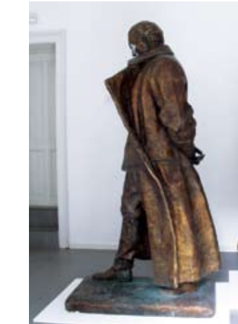
7. JOSIP BROZ TITO (SPOMENIK TITU) 1948. bronca, 1981.? vis. 202 cm bez signature inv. br. GA – 353 P autorizirani odljev