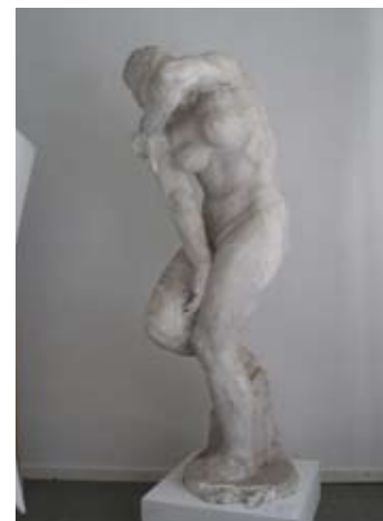
12. BRIJUNSKI AKT (STID, EVA) 1948. gips vis. 172 cm bez signature inv. br. GA – 168 varijanta