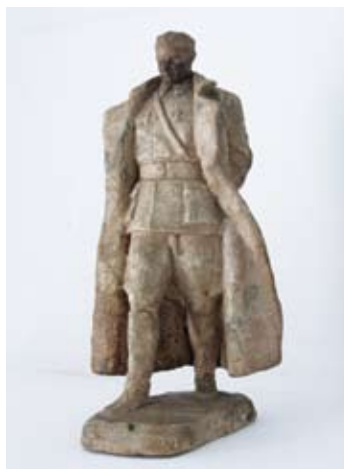
1. SKICA ZA SPOMENIK TITU 1947. gips vis. 23 cm bez signature inv. br. GA – 50 model