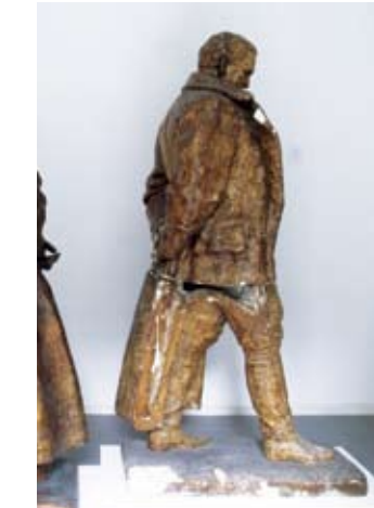
6. JOSIP BROZ TITO (SPOMENIK TITU) 1948. gips vis. 210 cm bez signature inv. br. GA – 75 model