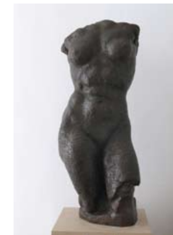
14. ŽENSKI TORZO 1941., bronca, 2008., vis. 89 cm sign. d. I. A. AUGUSTINČIĆ natpis d. straga LJEVAONICA UMJETNINA ALU 2008 1/1 inv. br. GA – 387 autorizirani odljev brončane verzije