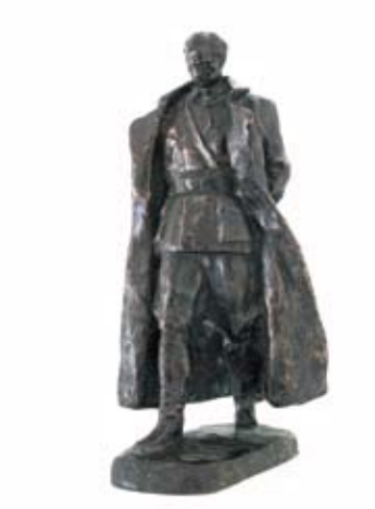
2. SKICA ZA SPOMENIK TITU 1947. bronca vis. 22,3 cm sign. d. d. AUGUSTINČIĆ inv. br. GA – 369 autorski odljev/replika?