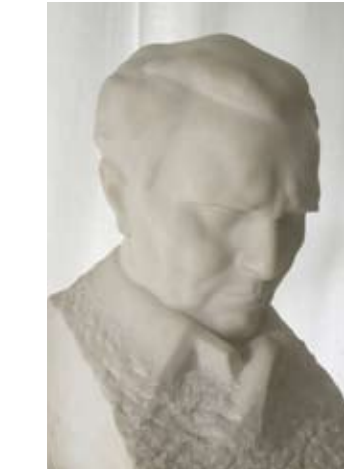
8. PORTRET JOSIPA BROZA 1952. bijeli mramor vis. 46,5 cm sign. d. d. AUGUSTINČIĆ inv. br. GA – 9 verzija fragmenta