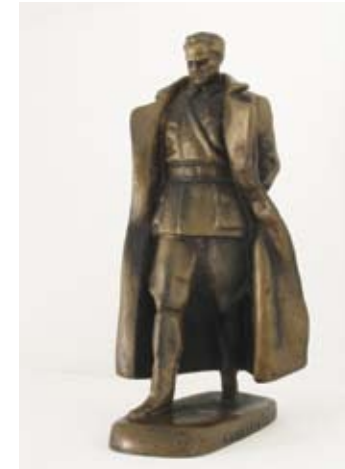
5. SKICA ZA SPOMENIK TITU 1947. bronca, 1978.?, vis. 22 cm sign. I. d. A. AUGUSTINČIĆ natpis ispod ZENIT KUMROVEC punca ispod LJEVAONA D. ULAMA inv. br. GA – 386 multipl