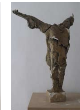
17. SKICA ZA SPOMENIK DARINKI RADOVIĆ 1958. gips vis. 68 cm bez signature inv. br. GA – 61 .