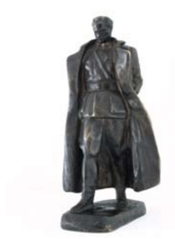
4. SKICA ZA SPOMENIK TITU 1947. bronca, 1978.? vis. 22 cm sign. I. d. A. AUGUSTINČIĆ natpis ispod ZENIT KUMROVEC inv. br. GA – 343 multipl