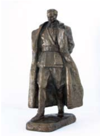
3. SKICA ZA SPOMENIK TITU 1947. bronca, 1986. vis. 22 cm bez signature inv. br. GA – 190 autorizirani odljev