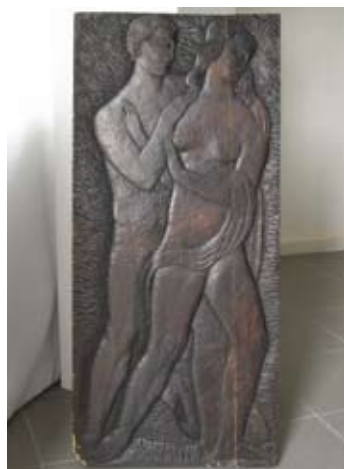
10. Ljubavnici 1925. drvo 88,5 x 40 cm bez signature Gradski muzej Varaždin inv. br. GMV GS 254 unikat