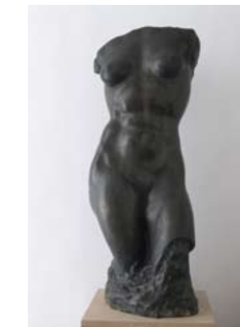
16. ŽENSKI TORZO 1941. bronca vis. 92 cm signatura I. d. AUGUSTINČIĆ inv. br. GA – 37 autorski odljev kamene verzije