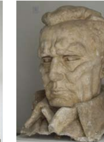
9. GLAVA MARŠALA TITA – VELENJE 1977. gips vis. 120 cm bez signature inv. br. GA – 144 uvećana replika