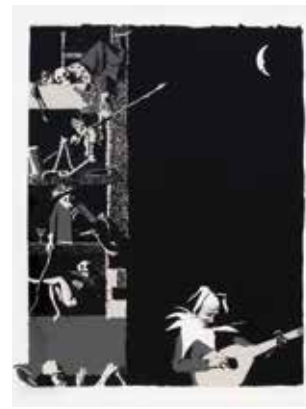
Miljenko Stančić List iz mape Kervave kronike glas 1971. 70 × 50 cm, serigrafija Tomislav Beroš, Sesvete