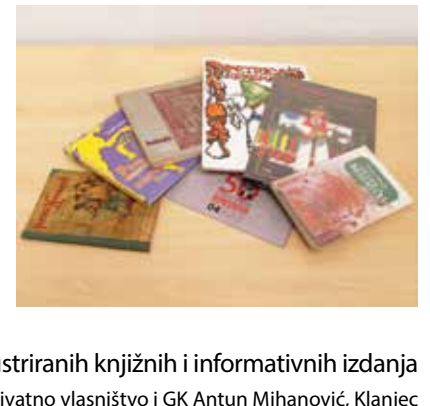
Izbor ilustriranih knjižnih i informativnih izdanja privatno vlasništvo i GK Antun Mihanović, Klanjec