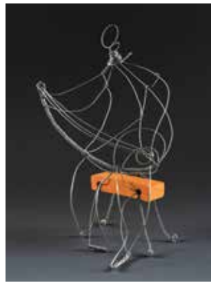
Iva Perović Petrica Kerempuh 2012. žica, terakota, vis. 25 cm Davor Zanoški, Zagreb