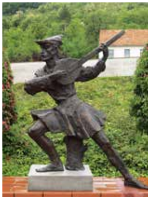
Antun Augustinčić Petrica Kerempuh 1973. bronca, vis. 146 cm Galerija Antuna Augustinčića, Klanjec