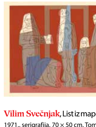
Vilim Svečnjak , List iz mape Kervave kronike glas 1971., serigrafija, 70 × 50 cm, Tomislav Beroš, Sesvete