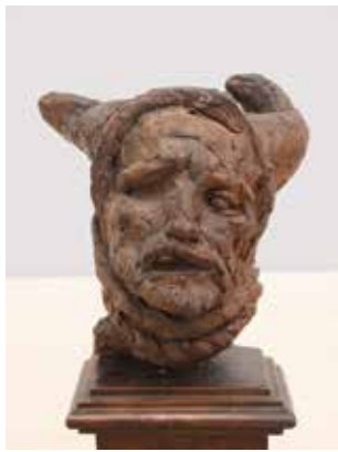
Vanja Radauš Glava Petrice Kerempuha oko 1940. terakota, vis. 12 cm obitelj Mršić Flögel Dvorac Sveti Križ Začretje