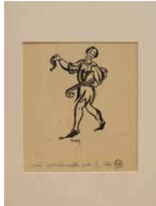
Krsto Hegedušić Petrica Kerempuh (ilustracija za Balade Petrice Kerempuha Miroslava Krleže) 1945. tuš na kartonu, 36 × 25 cm Muzej suvremene umjetnosti, Zagreb